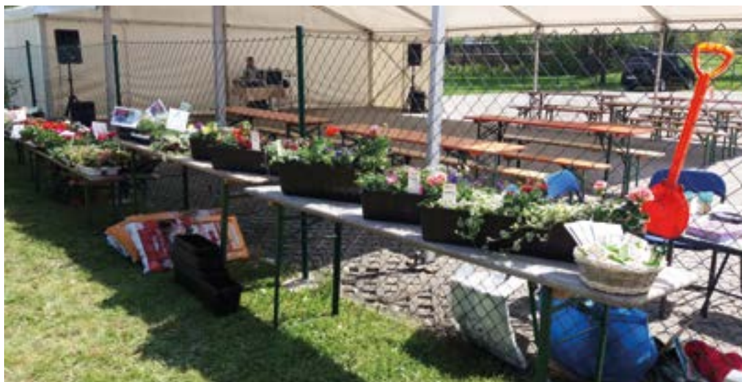
Fertige Blumenkästen warten auf ihre neuen Besitzer