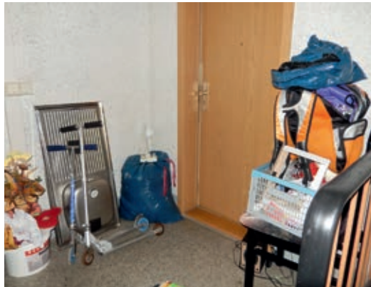
So darf ein Treppenhaus nicht aussehen