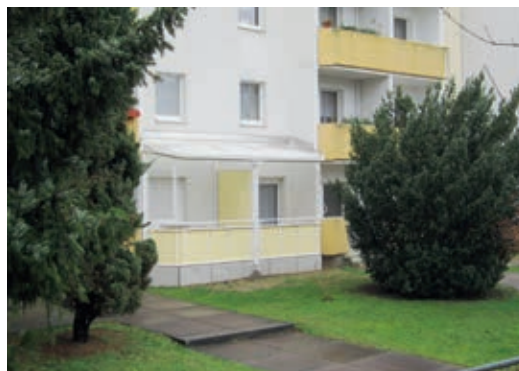
Terrasse Mühlgasse 3/5

Im Dezember 2015 konnten der Anbau einer überdachten Doppelterrasse am Gebäude Mühlgasse 3/5 und eines Balkonturmes am Gebäude Mühlgasse 7 fertiggestellt werden. Nunmehr sind alle Wohnungen in den genannten Gebäuden mit Balkonen bzw. Terrasse ausgestattet. Damit haben wir einen weiteren Schritt zur Aufwertung unseres Wohngebietes in der Innenstadt unternommen.