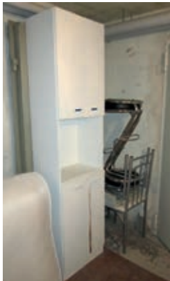
Sperrmüll im Kellergang

Helfen Sie mit, Gefährdungspotenziale zu vermeiden. Sorgen Sie für unbeschränkte Fluchtwege und gewährleisten Sie Rettungskräften im Ernstfall den ungehinderten Zugang, indem Hindernisse entfernt und Stolperstellen beseitigt werden. Beseitigen Sie Sperrmüll u. Ä. aus den Kellergängen, allgemein zugänglichen Keller- und Bodenräumen sowie unter Kellertreppen. Vermeiden Sie Brandgefährdungen.